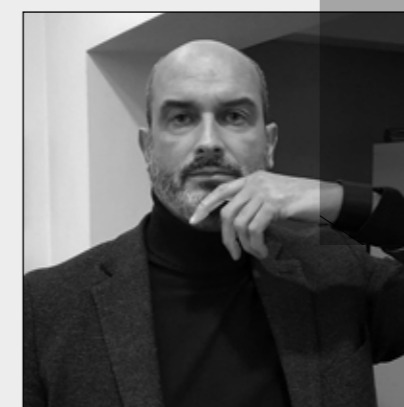
Canapé Stelvio by Maurizio Manzoni