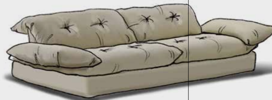
Canapé Cloud by Studio Red