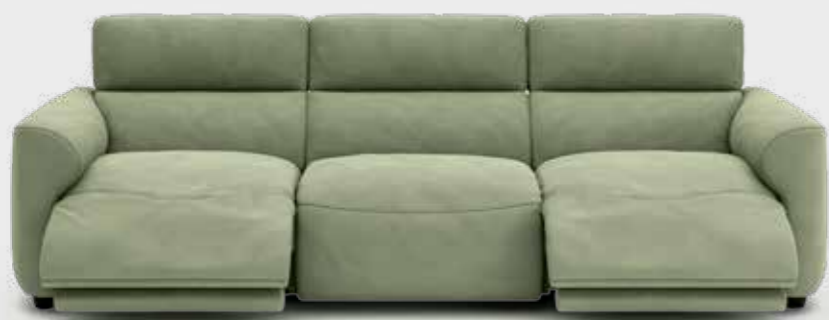
Canapé Wonka by Centro Stile Chateau d'Ax

Chaque nouveau modèle est le fruit d'une recherche stylisée approfondie, où la signature de brillants esprits et de studios de design s'allie à notre vision de l'habitat contemporain. Ensemble, nous transformons le concept de confort en un véritable art.